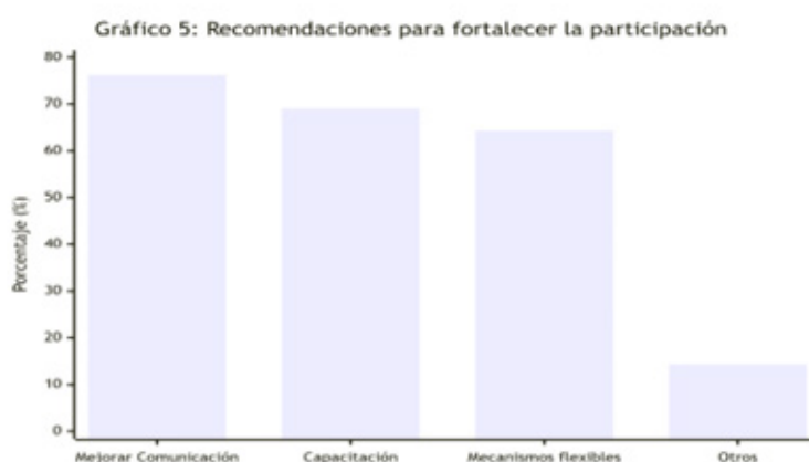
Gráfico 5. Recomendaciones para fortalecer la participación ciudadana

Desde un análisis cualitativo se puede apreciar que los resultados expresan que los participantes valoran un panorama donde la participación ciudadana en las iniciativas de la Cámara de Comercio de Gualaquiza se devela como predominantemente endeble y poco efectiva. Esto no se debe a una apatía generalizada de la ciudadanía, sino a un conjunto de barreras que han sido identificadas de manera consistente en contextos similares.