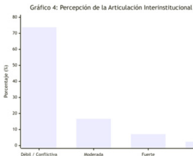
Gráfico 4. Articulación interinstitucional

Análisis de la pregunta: ¿Según su criterio cuáles son los factores sociales, económicos y culturales que están limitando la participación ciudadana en los proyectos de desarrollo local implementados por la Cámara de Comercio de Gualaquiza?