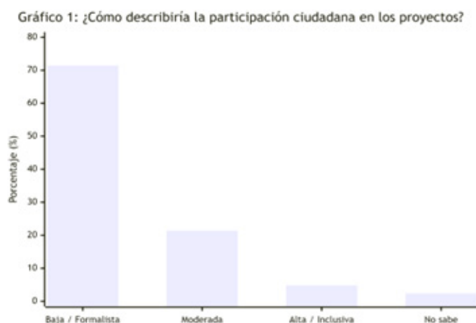
Gráfico 1. Descripción de la participación ciudadana

Análisis de la pregunta: ¿Cuáles considera que son las principales fortalezas y debilidades de la Cámara en materia de participación ciudadana?