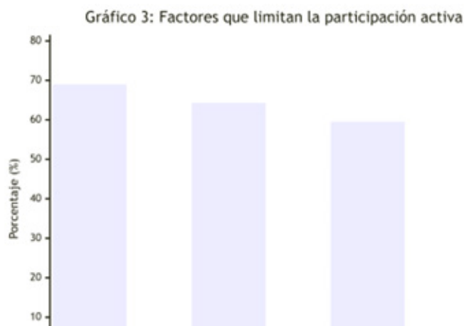
Gráfico 3. Factores que limitan la participación activa

Análisis de la pregunta: ¿Cómo percibe la articulación entre la Cámara de Comercio, el GAD Municipal y otros actores en el desarrollo local?