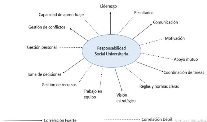
Figura 2. Relación entre la Responsabilidad Universitaria y los elementos asociados a la Calidad directiva.

Por tanto, se puede concluir que el Liderazgo, Gestión de conflictos, Comunicación, Toma de decisiones, Visión estratégica y Coordinación de tareas poseen relación con la responsabilidad social universitaria.