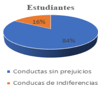
Figura 2. Observación a estudiantes

Se pudo constatar que el 67%, (2) dan tratamiento a la problemática racial, aun cuando no está explícito en los contenidos que imparte, estos docentes tienen en cuenta en el desarrollo de aprendizajes, actividades que hacen énfasis en la integralidad desde los diversos contextos sociales, sin embargo, en el 33.3% (1), fue insuficiente esa mirada.