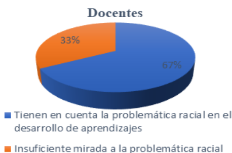
Figura 1 Observación a clases de docentes.

Datos de la observación a las clases entorno al tratamiento de la racialidad desde el programa de Educación Moral y Ciudadana en 8vo en la muestra de la Secundaria Básica Espino Fernández en Santiago de Cuba (2025).