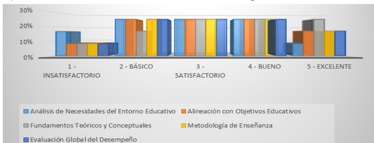
Figura 1 Resultados de la rúbrica de evaluación para medir el contexto del programa

En esta fase, se analizan los resultados obtenidos en la Fase I: Diagnóstico causal del problema, destacando las percepciones, las necesidades identificadas y las áreas de mejora sugeridas tanto por los estudiantes, docentes y autoridades de la institución donde se desarrolló la investigación.