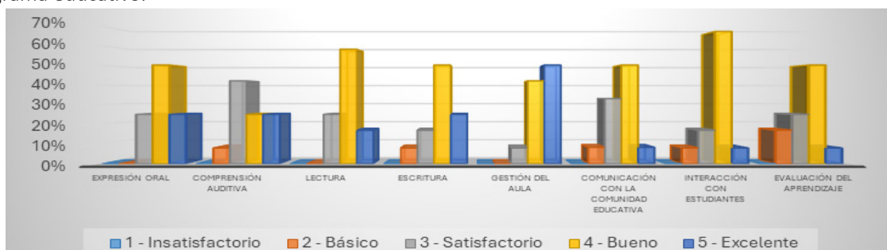
Figura 2 Resultados de la ficha de observación de clases a los docentes.

Estos resultados sugieren que la mayoría de los docentes evaluados demuestran competencia en varios aspectos clave de la enseñanza de lenguaje y comunicación, aunque existen áreas específicas donde algunos podrían beneficiarse de apoyo adicional o desarrollo profesional continuo. La variabilidad en los porcentajes también indica la diversidad en las fortalezas y áreas de mejora entre los docentes evaluados, proporcionando una base sólida para la planificación de estrategias de desarrollo profesional y mejora continua dentro del programa educativo.