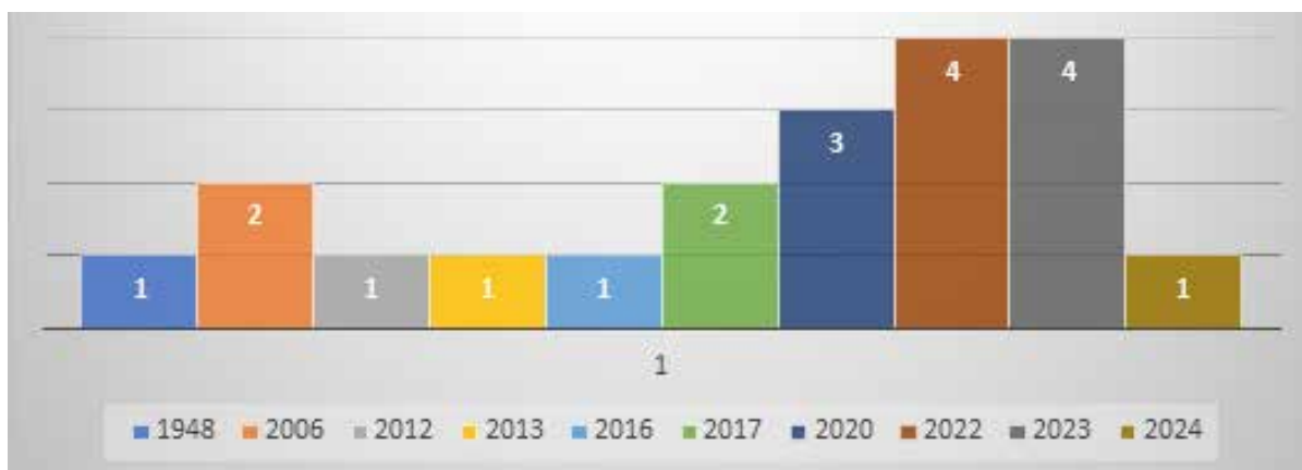
Figura 2 Distribución de los artículos según años de publicación

En la figura 2 se analizan la asignación de las publicaciones por el año de publicación. Se refleja un número mayor de divulgación son: en los años 2022 y 2023 con 4 (23% cada uno), 2020 con 3 (15%), 2006, 2017 con 2 cada uno (10% cada uno) 1948, 2012, 2013, 2016, 2024 con 1 cada uno (5% cada uno)