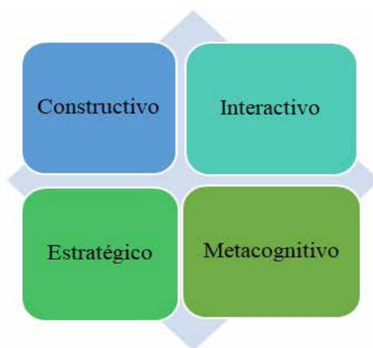
Fig. 1 Características de la comprensión lectora

En la figura 1, de acuerdo con Benito-Durán et al. (2015) se deduce que la comprensión lectora es un proceso que se caracteriza por ser constructivo, interactivo, estratégico y metacognitivo. Es un proceso constructivo porque favorece la producción de conocimientos mediante la interpretación del contenido. Es un proceso interactivo ya que existe un nexo entre el lector y el texto. Es estratégico porque la persona que lee adopta la mejor estrategia posible para comprender lo que lee. Y, es un proceso metacognitivo porque se integra al conocimiento, la concientización, el control y la naturaleza de los procesos de aprendizaje propio.