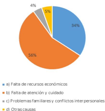
Gráfico 2 Principales causas del adulto mayor

El mayor porcentaje de los encuestados indica que la principal causa del abandono familiar del adulto mayor es la falta de atención y cuidado, mientras que la media cree que es debido a la falta de ingresos económicos, el porcentaje menor por problemas familiares y conflictos personales. Por lo consiguiente se demuestra que la falta de recursos económicos acarrea problemas y conflictos personales (Gráfico 2).