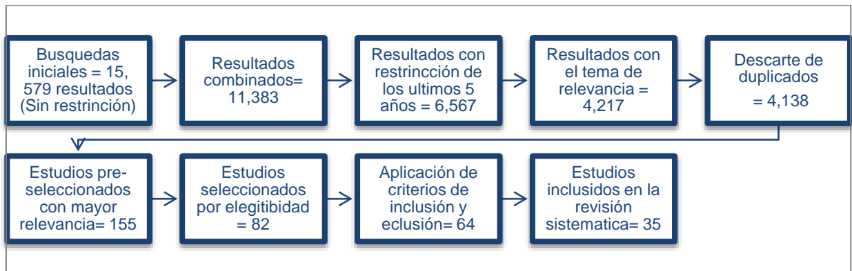
Figura 1. Proceso de base de datos.

De acuerdo con la búsqueda del estudio, se ha considerado los últimos 5 años en virtud de que estos artículos mantienen una vigencia actualizada y realidad sobre la evaluación formativa, además considerando con mayor relevancia el idioma inglés y español al tener mayor accesibilidad y complejidad. Se identificaron aspectos relevantes en los resultados, discusiones y conclusiones de cada investigación. Entre los aspectos reiterativos se encontraron diversas definiciones y teorías sobre la evaluación formativa. La tabla 1 y figura 1 muestran el proceso seguido.