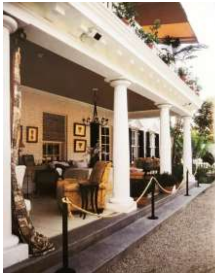
Figura 6. Intervención en el Pórtico posterior de la Casa Ostendorf para Casa Cor 98. Tomado de la Revista Diseño de Espacios , 1999, (6), p. 74.